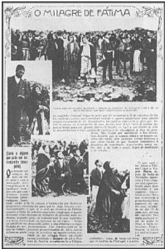
(文章来源，百度百科·法蒂玛事件)

第三个秘密内容直到2000年6月才公开，有报导说一直到1960年才由教皇一人打开读过。据说梵帝冈教皇曾告诉过他身边的人说，当他读了秘密的内容后，恐怖得几乎昏了过去。