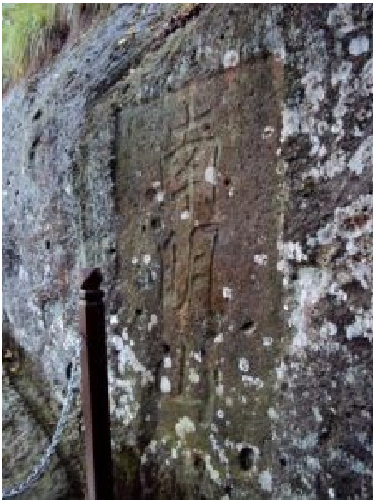
北宋杰出书画家米芾书写的“南明山”

6月14日，大同师尊带领四位学生来丽水做探秘旅游；抵丽水时已近中午。作为东道主的我，先带师尊到丽水有名的山珍小店——绿谷山珍用午餐，品一品丽水盛产的野生菌菇。席间，我们向师尊建议，游丽水不妨去三个地方：相传葛洪炼过丹的南明山、黄帝骑龙升天的仙都、刘伯温年轻时学法修炼的青田石门洞。师尊采纳了我们的建议。