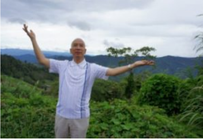
师尊在神山脚下习练