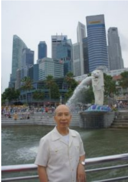
新加坡的守护神——鱼尾 狮神

大同师尊接受马来西亚学员们的盛情邀请，于2013年8月7日~8月21日访问马来西亚。