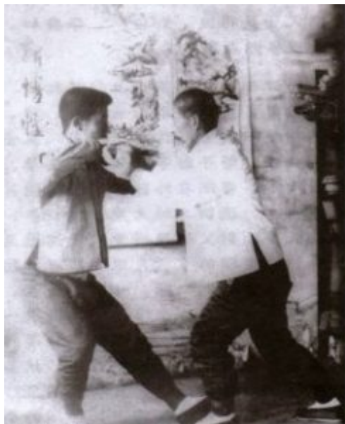
孙禄堂和儿子孙存周在推手

1、据《社会日报》1930年5月11日——向恺然记述（摘录），“孙禄堂虽出自河北，可他在拳术界的声望却是全国宗仰，他的功夫不仅是形意、太极、八卦之类，而且还有几位异人的传授，其中一位叫做陈乐天，他最惊人的能耐是御气飞行，陈乐天把这种功夫也传给了孙禄堂。孙禄堂在东北时，靠这种功夫背负炸药飞越悬崖峭壁，协助当地驻军剿灭匪巢。