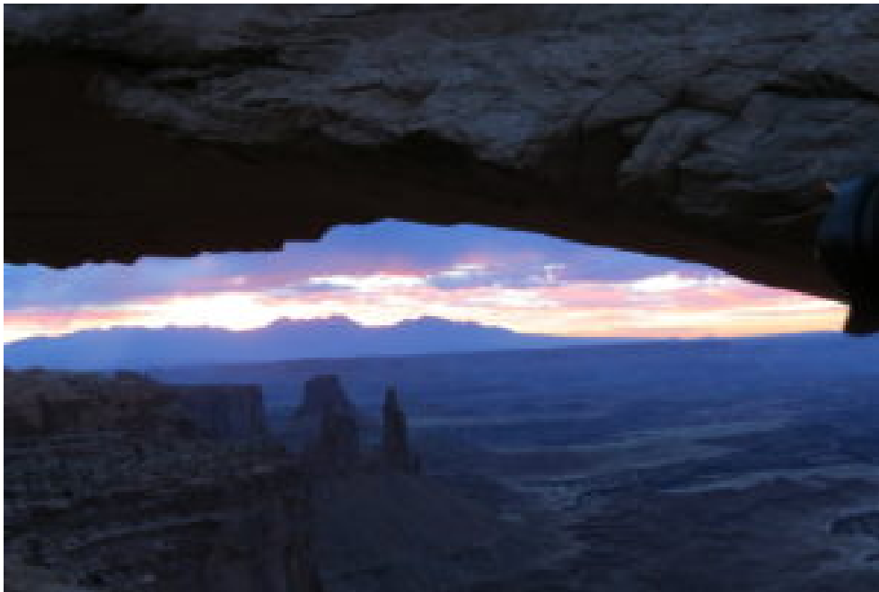
峡谷旭日升 慈航普渡时

美国峡谷地国家公园位于美国西部犹他州的东南，在格林河和科罗拉多河汇合处，其壮丽景观系由多年河流冲刷和风霜雨雪侵蚀而成，乃世界上最著名的侵蚀区域之一。公园占地面积1366平方公里，分空中岛屿区、针尖景区、迷宫景区三部分。这里是一片广漠无边、大开大合的荒野风光。这里也有平坦的高地，突然下陷而成千沟万壑；河道在沟壑中左冲右突而形成无数峡谷。