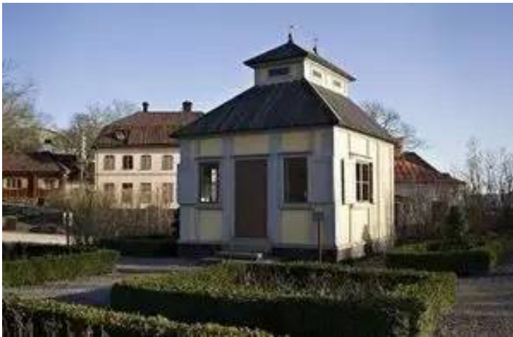
史威登堡在首都斯德哥尔摩的家