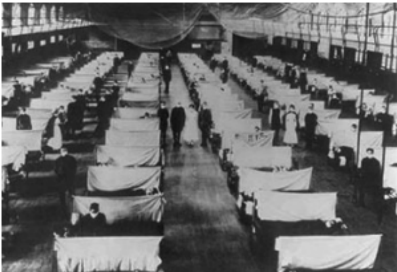
1918年的欧洲和美国，不得不忍受战争和疾病带来的双重痛苦。

这真是名副其实的杀人流感，其死亡率高达2.5%，是一般流感的20~25倍。经常会发生这样的事，几个朋友上班的路上还在聊天，其中1个人突然得了流感，还没等到下班就死去了。还有一个更恐怖的例子，4个女人兴致勃勃地玩桥牌到深夜，相继得了流感，一夜之间竟然死了3个。