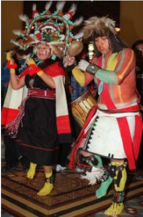
美国亚历桑那州的霍比印地安族人正表演其传统舞蹈