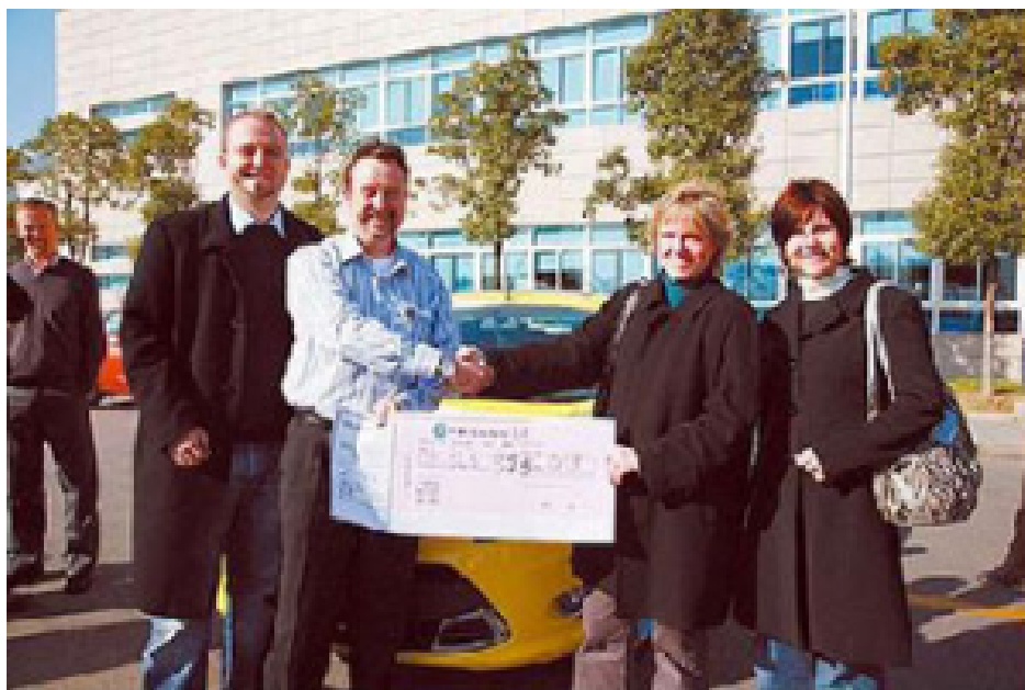
普方协会接受善款

几个月后，普方家人和朋友成立了普方协助会，筹集善款积极去改变苏北贫困地区的教育现实。按照普方协会的要求，孤儿、单亲家庭、父母患重病者和女孩被列为优先资助的对象。女孩将来是要当妈妈的，妈妈在孩子成长中有着举足轻重的影响。普方的家人和朋友们深信，只要能有良好的教育，“有机会的话，人就不会想去做坏事，他会做好事，这对自己，对别人都有好处。”