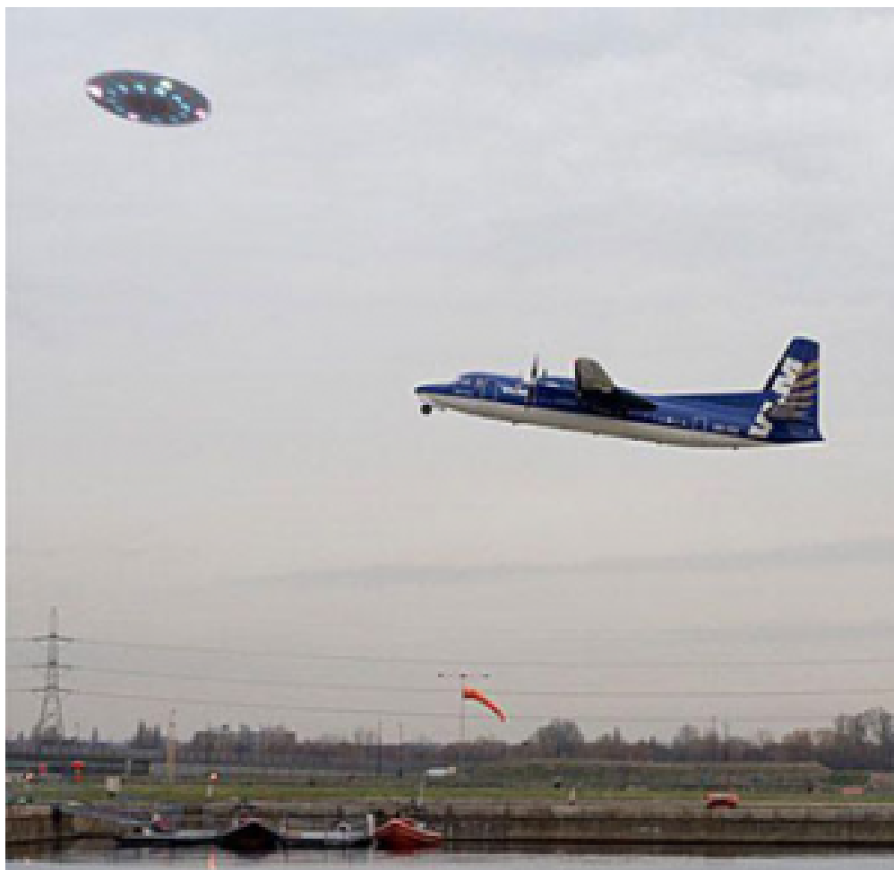
不明飞行物与飞机近距离接触

近日，中国境内频频有目击者声称见证了不明飞行物(UFO)的神秘造访，相关视频和照片在网上疯传；前不久在沪举办的UFO光学信息研讨会上，专家和天文爱好者就UFO之谜进行激烈讨论并引发社会围观。