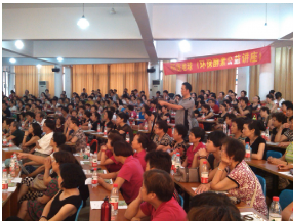
认真听演讲的来宾