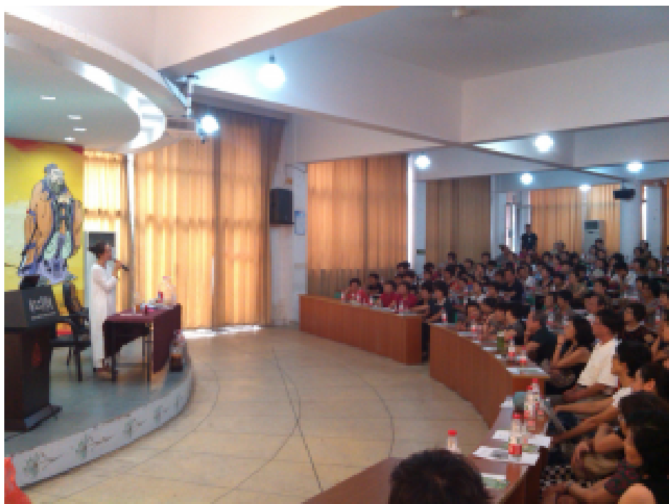
阿旺姐第二次来做公益演讲