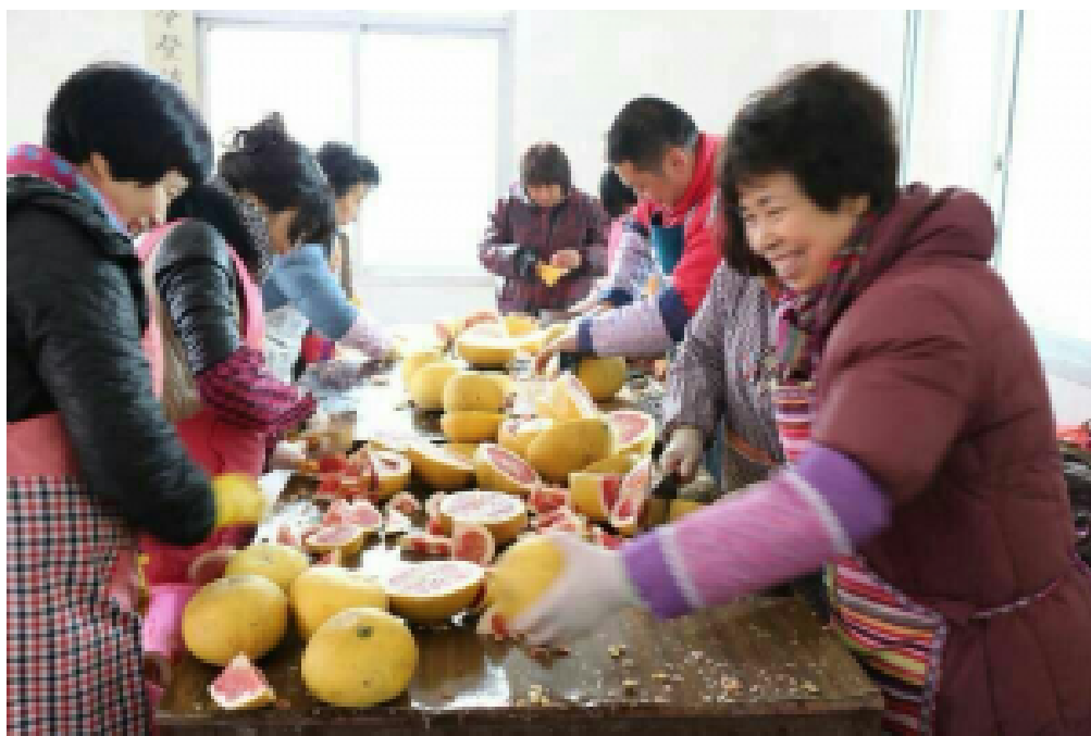
切柚子手都起泡了，心情却是喜悦

那天红萝山上的气温很低，可大家却干得热火朝天，一位年逾古稀的林先生，老当益壮，专门负责掰开又