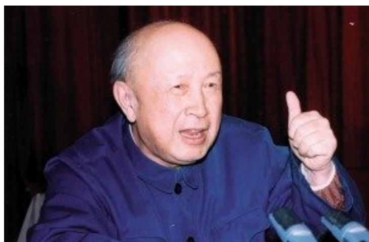
2000年，北京，钱学森在做科学报告

至于研究气功的意义，就不必多讲了，这确实是很了不起的事情。中国气功科学研究会成立了，这的确是一件大事。我国有10亿人口，如果100个人当中有1个人练功，就是1000万，每百个练功的人有1个人去教，就需要10万个气功师。把这10万个气功师提高提高，这就是一件大事。