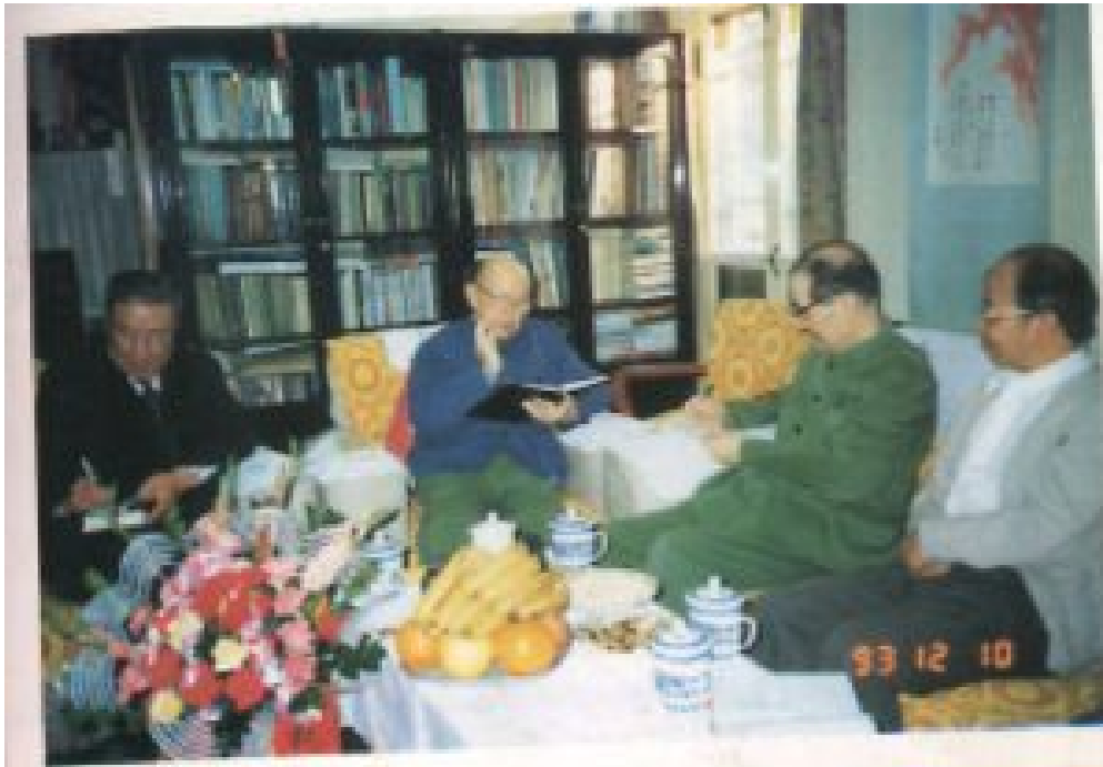
1994年第6期《中国气功科学》封面，左二：钱学森，左三：张震寰

核心提示： 我国有10亿人口，如果100个人当中有1个人练功，就是1000万，每百个练功的人有1个人去教，就需要10万个气功师。把这10万个气功师提高提高，这就是一件大事。