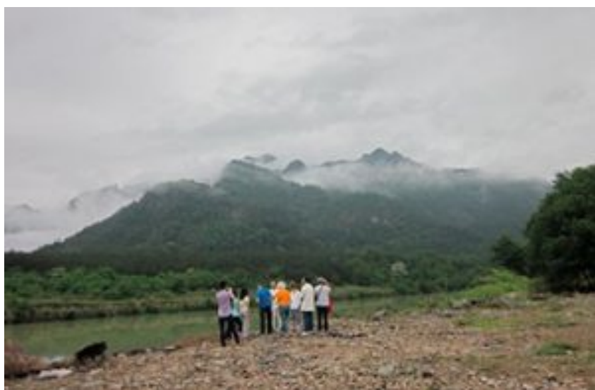
珠岸村前的笔架山