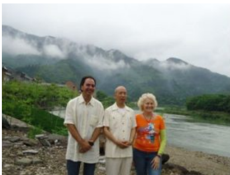
西班牙夫妻园友在村前楠溪江畔与师尊合影