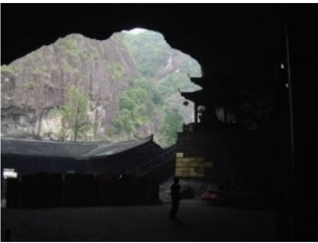
陶公洞是浙南最大的天然岩洞石室