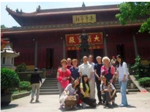
大同师尊和大家合影于净慈寺大雄宝殿前。