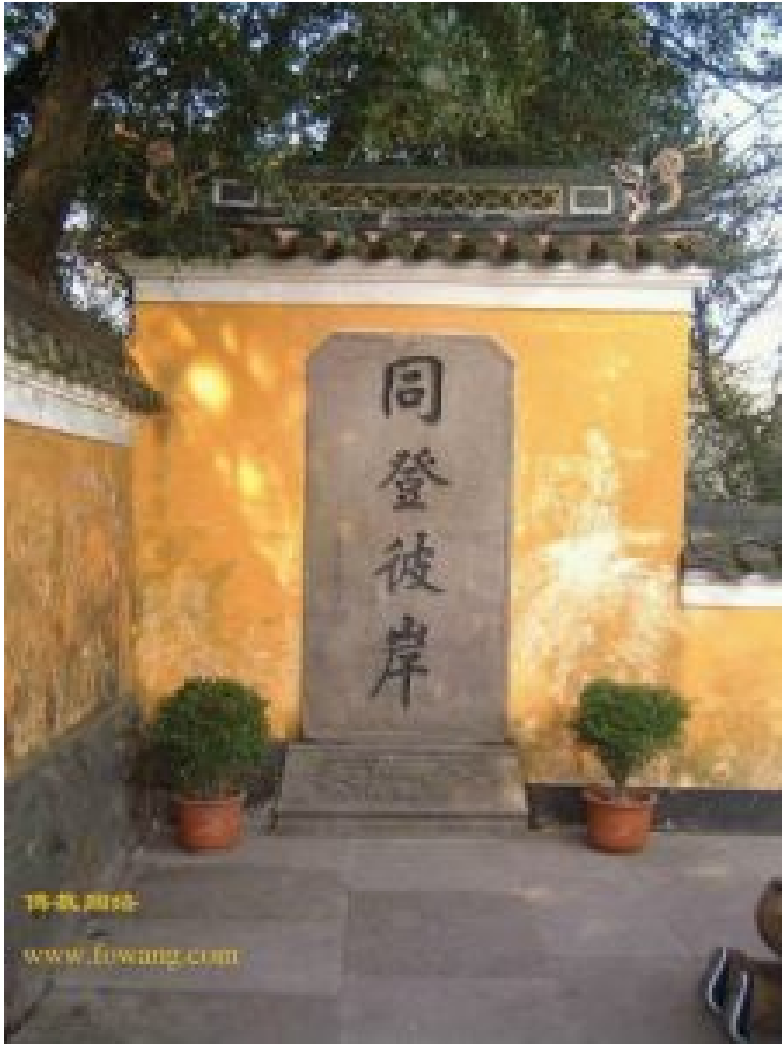
普陀山同登彼岸石碑