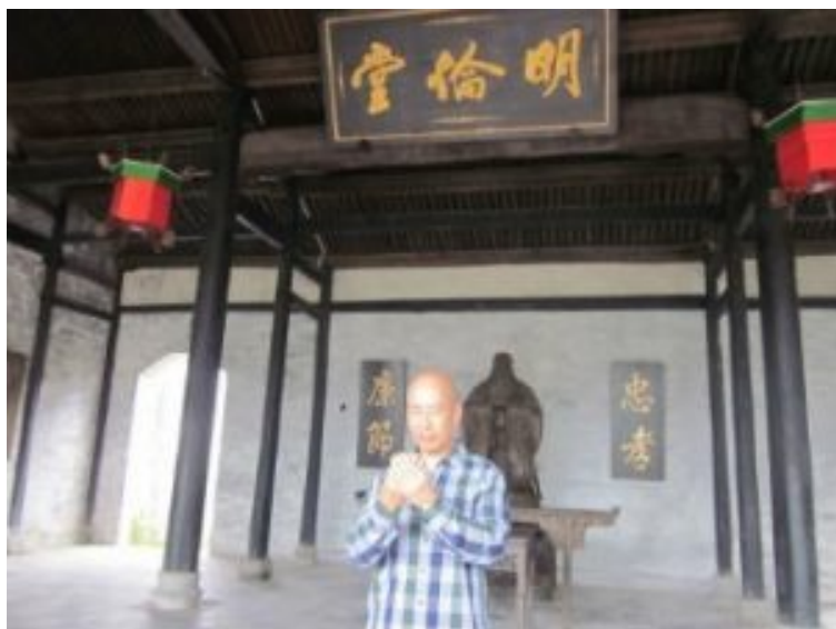
师尊在学人天礼仪