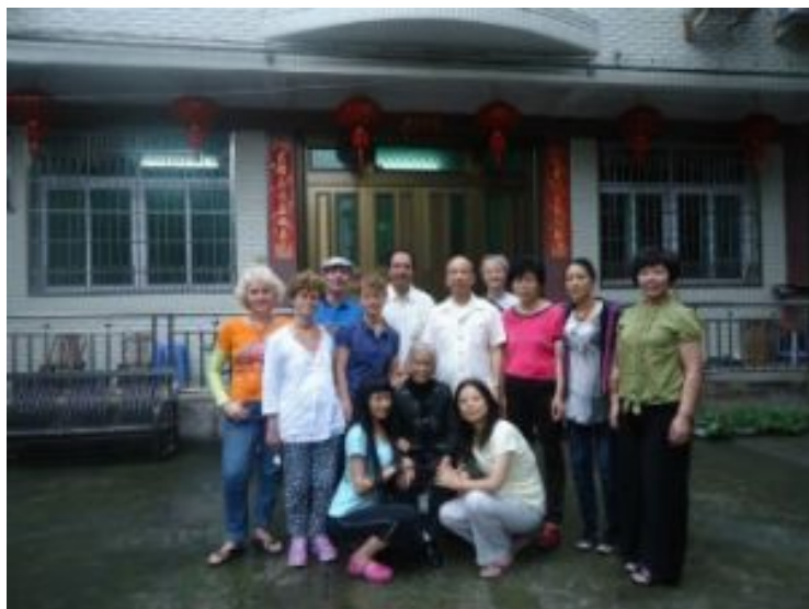
在师尊故居前，同师太和师尊合影。

我们十几位来自西班牙、澳大利亚和德国的园友，结束了普陀山之行，在师尊的带领下，开始前往师尊的家乡——楠溪江畔的永嘉县珠岸村。