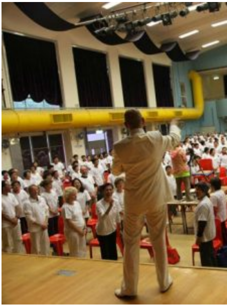
师尊在激发心灵歌

俗话说“病由心生”。师尊说，要治病，先要正心。好的音乐能正心，好的声音会救众生。语言是信息，声音是载体。“音乐是藥”秘法，提高了心灵语、心灵歌的能量场、能量级别，使我们的正意念力越来越强大，送给自己的身、心、灵，身边的亲人，以及素不相识的人。我们有此机会接受宇宙高维能量的洗礼，挖掘心灵深处的语言、歌声，优化肉体、纯化心灵，同时把心灵语、心灵歌作为福音，传送出去，造福人类、造福地球，这是宇宙给我们的神圣使命。