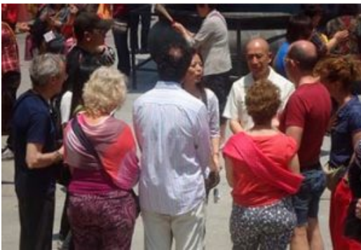
净慈寺，师尊讲济公……