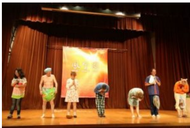
西班牙学员在晚会上