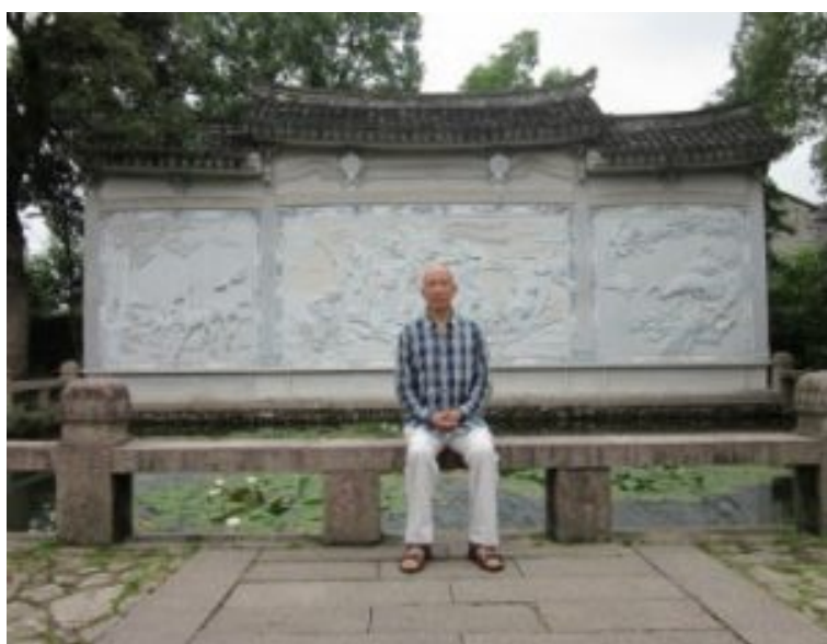
师尊在“八仙乘槎图”前