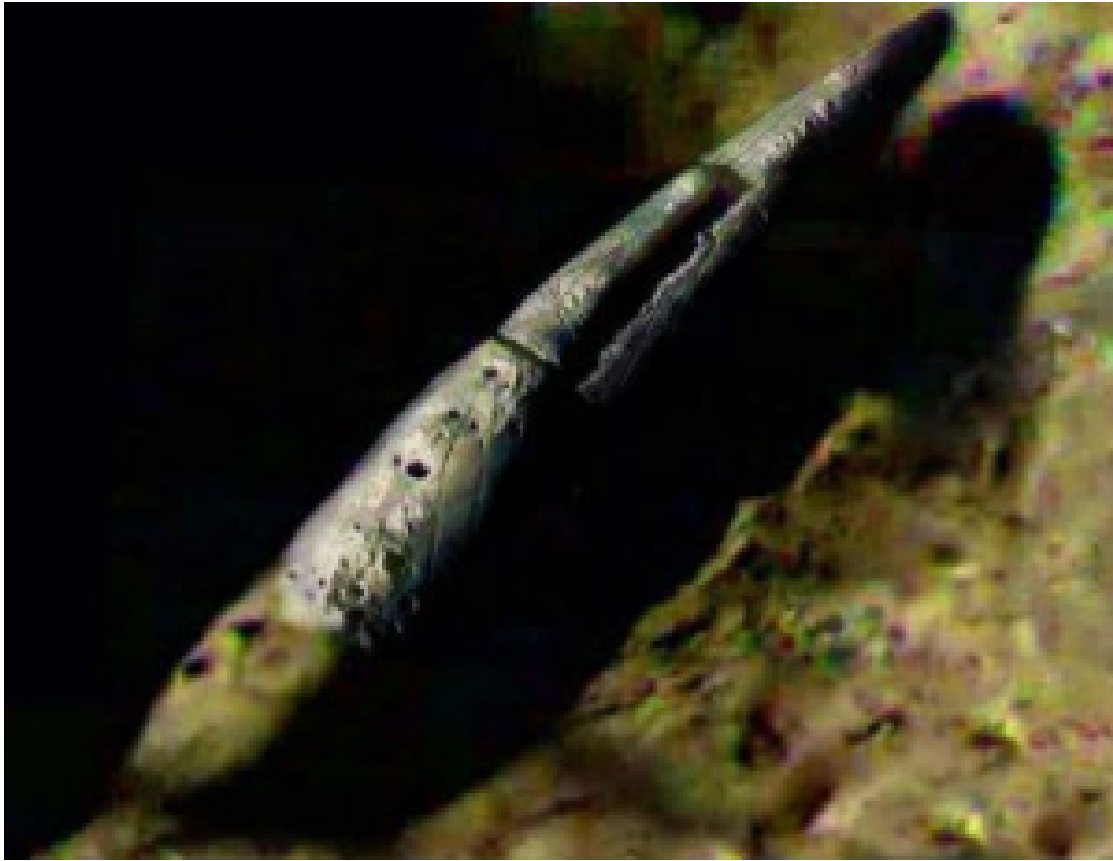
月球上发现的巨型宇宙飞船